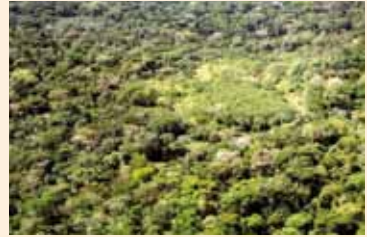
Réhabilitation de site Yariapo X1