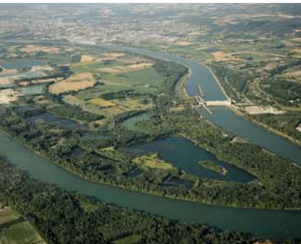
La carrière réaménagée vue dans son ensemble.

La poursuite de son activité économique dans la logique de concertation et de création de zones à vocation écologique permet à DAG de conforter son image au niveau local ainsi que celle du métier de carrier, ce qui est aujourd'hui indispensable pour accéder à des ressources minérales de plus en plus rares et protégées.