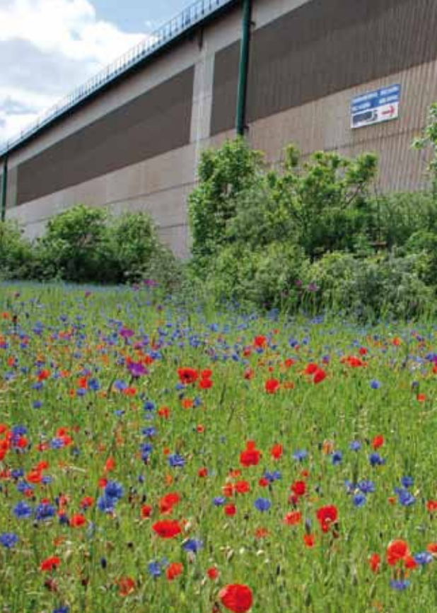
Jachère fleurie à côté du laminoir à chaud de l'usine.

prendre en compte les corridors écologiques locaux entre l'usine de Dunkerque, la zone ZNIEF «Les Salines» et l'usine de Mardyck. De ce fait une bande verte a été mise en place tout le long de la bordure sud de l'usine sur les recommandations du GON.