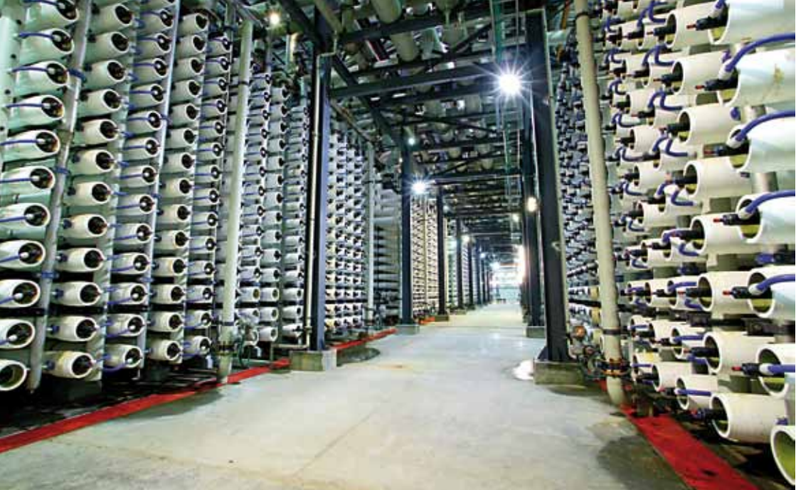
Galerie de filtres de l'usine de dessalement par osmose inverse d'Ashkelon en Israël.