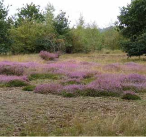
Vue sur les milieux reconstitués par les opérations de transfert.

Le modelage de la zone a été réalisé de façon à favoriser l'écoulement des eaux de surface pour éviter toute stagnation d'eau néfaste au développement des végétaux. Les pentes relativement douces des entités réceptacles favorisent l'intégration paysagère de l'aménagement.