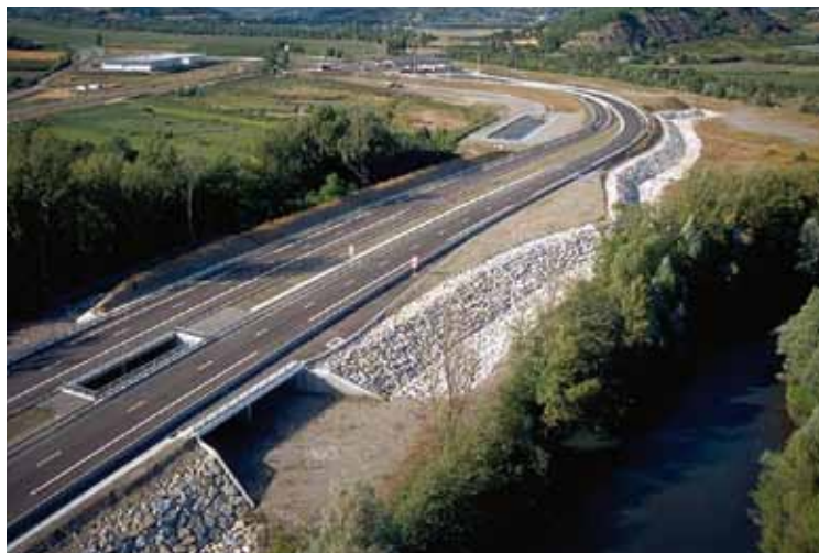
Passage à faune sous l'autoroute A51.

aval de la zone des Piles, est très efficace, celui de la grande Sainte Anne est efficace mais peu fréquenté. Peu végétalisé, il subit des dégradations liées aux passages de véhicules. Son attractivité pourrait être renforcée par des aménagements légers. Les passages supérieurs mixtes de la Plaine et du Beynon sont inopérants car leur conception se révèle au final inadaptée et le canal EDF qui les longe constitue à leur niveau un obstacle infranchissable. Une amélioration a posteriori semble difficile.