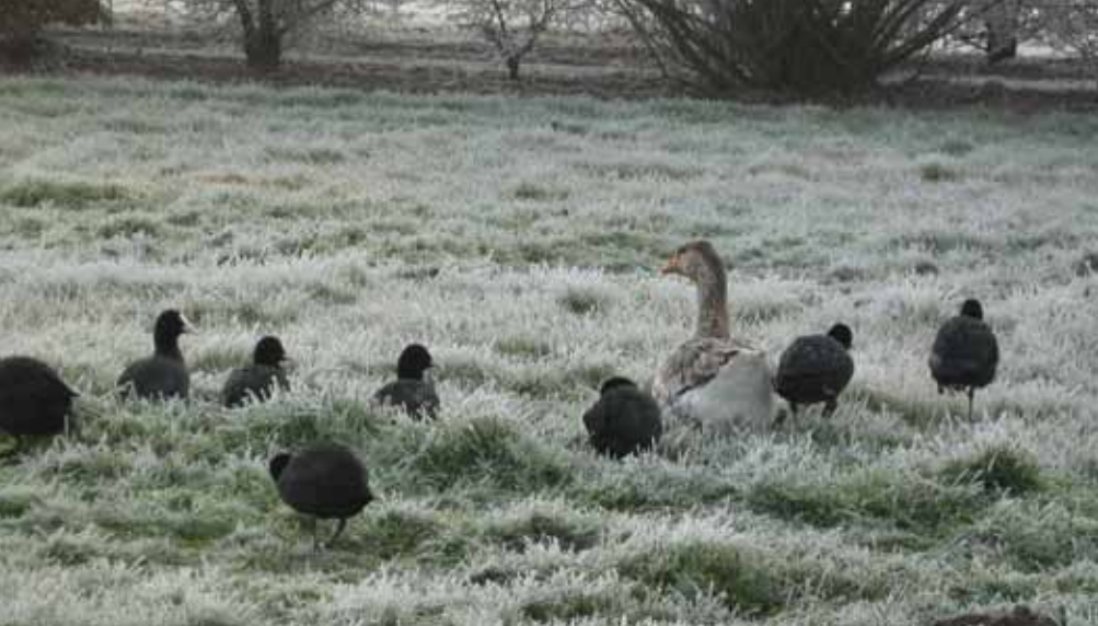
Oie, et poules d'eaux sur le site de Mardyck.

naturels constituent une réserve ornithologique de grand intérêt.