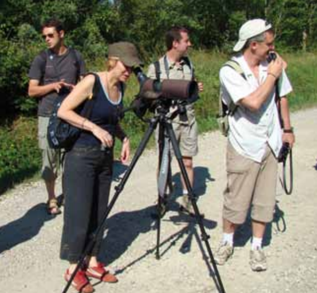
Organisation d'une sortie nature pour les salariés.