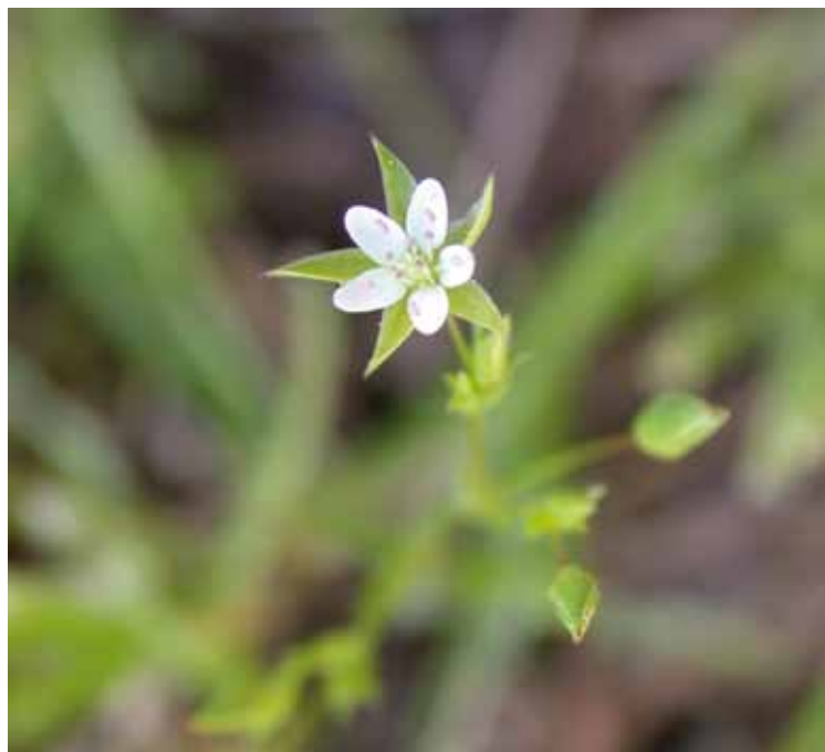
Alsine à feuilles ténues ( Minuartia hybrida ).