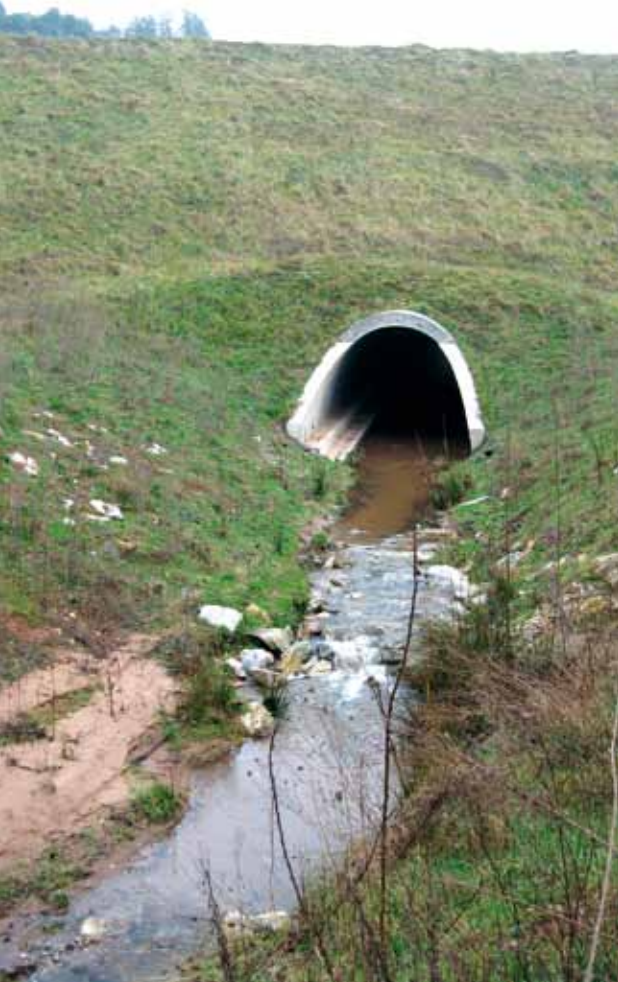
Passage à loutres sous l'autoroute A89.

lement pour ASF de préserver une espèce devenue rare mais aussi de lui permettre de poursuivre son extension géographique, d'où l'importance des passages sous l'autoroute.