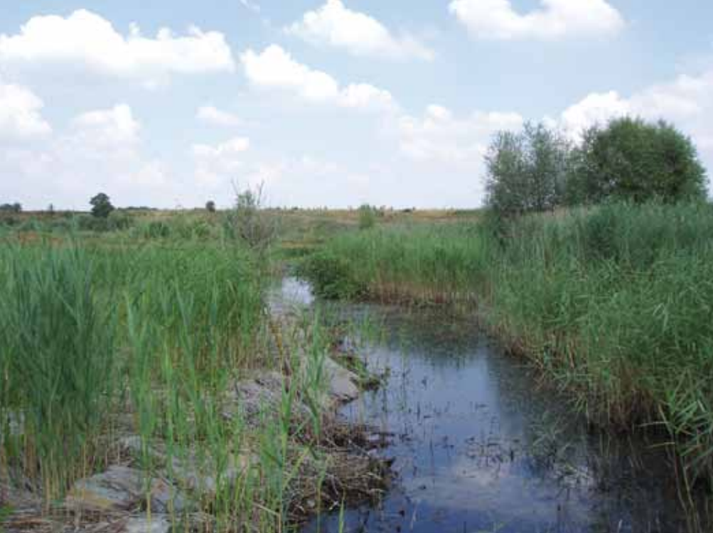
La mare sud après la réalisation des travaux.

pus. La mise en place d'un suivi permet une meilleure connaissance des espèces.