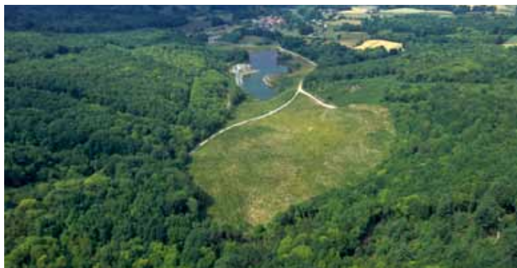
Exemple de site ayant bénéficié d'un réaménagement avec l'excavation transformée en plan d'eau.