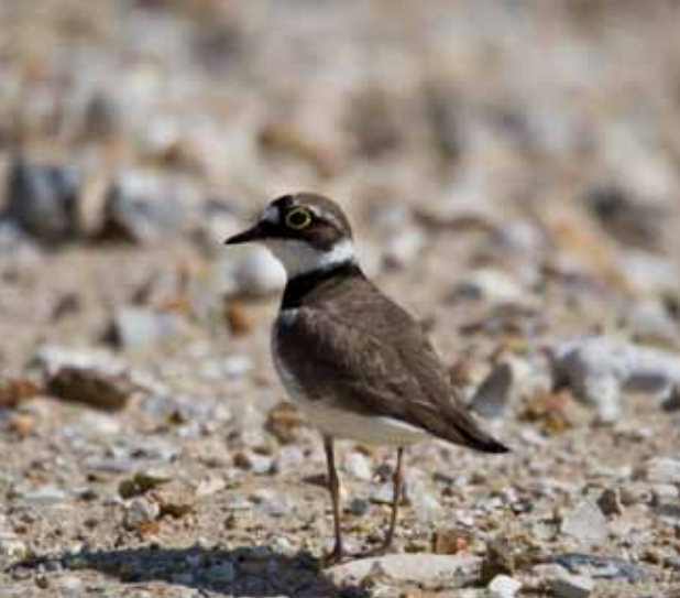
Un petit gravelot sur le site de Berville.

ainsi que sa gestion. Le GONm réalise également chaque année un suivi des espèces recensées sur le site.