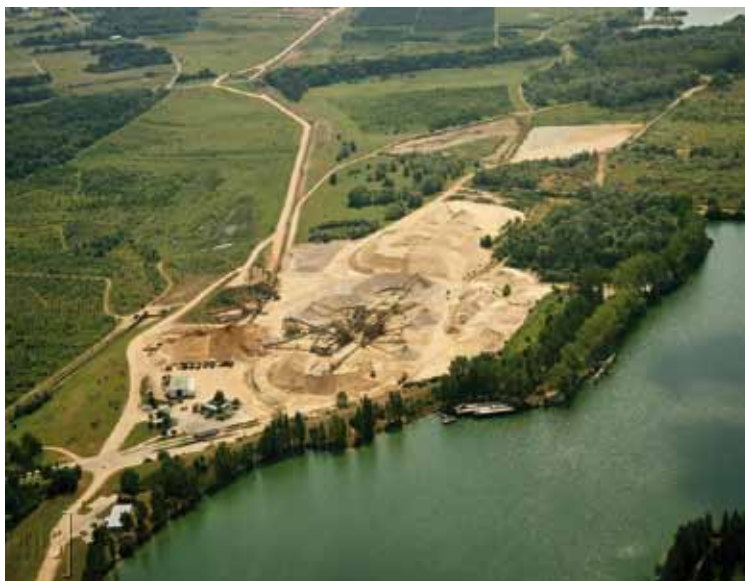
Site de Saint-Martin-la-Garenne.