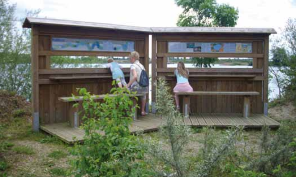
Structure aménagée pour le public.

faune» à la suite des observations et actions mises en place durant l'année 2007. Pour la LPO le site de Gerstheim est d'ores et déjà attractif pour de nombreux oiseaux nicheurs ou de passage. Cette diversité ornithologique est due à l'étendue du site d'une part, à sa situation d'autre part (proximité du Rhin et de la forêt rhénane), et enfin à la diversité des biotopes.