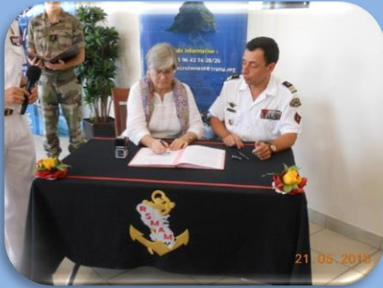
Académie RSMA Martinique : un partenariat de longue date