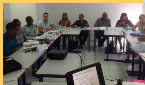
Certificat Professionnel de Formateur d'Adulte